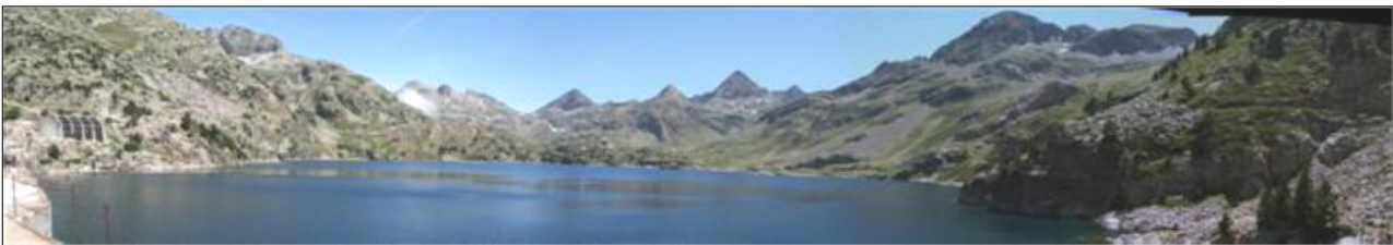
Vista del embalse de Respomuso en 2009