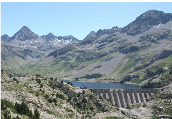
Imagen de la presa