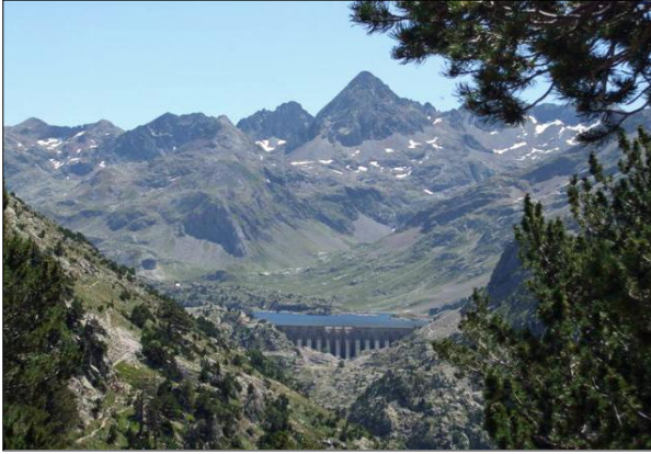
Vista del embalse de Respomuso en 2007