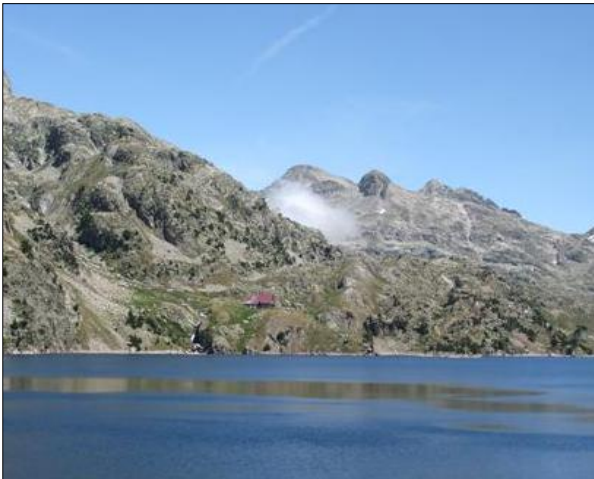
Vista del embalse de Respomuso, puede observarse el refugio al otro lado del embalse