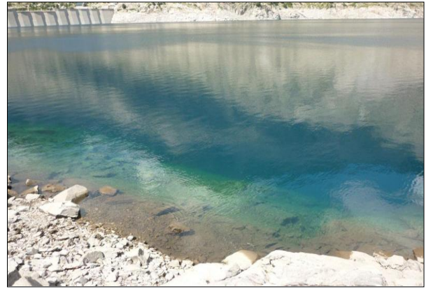
Imagen del sustrato en la zona litoral del lago